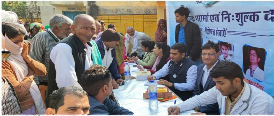
भरतपुर। होम्योपैथिक शिविर में उपचार कराते हुए ग्रामीणा।