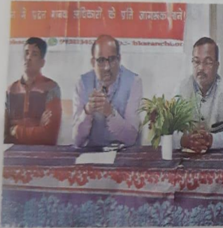
स्वाभिमान केंद्र में कार्यक्रम में मौजूद अतिथि।